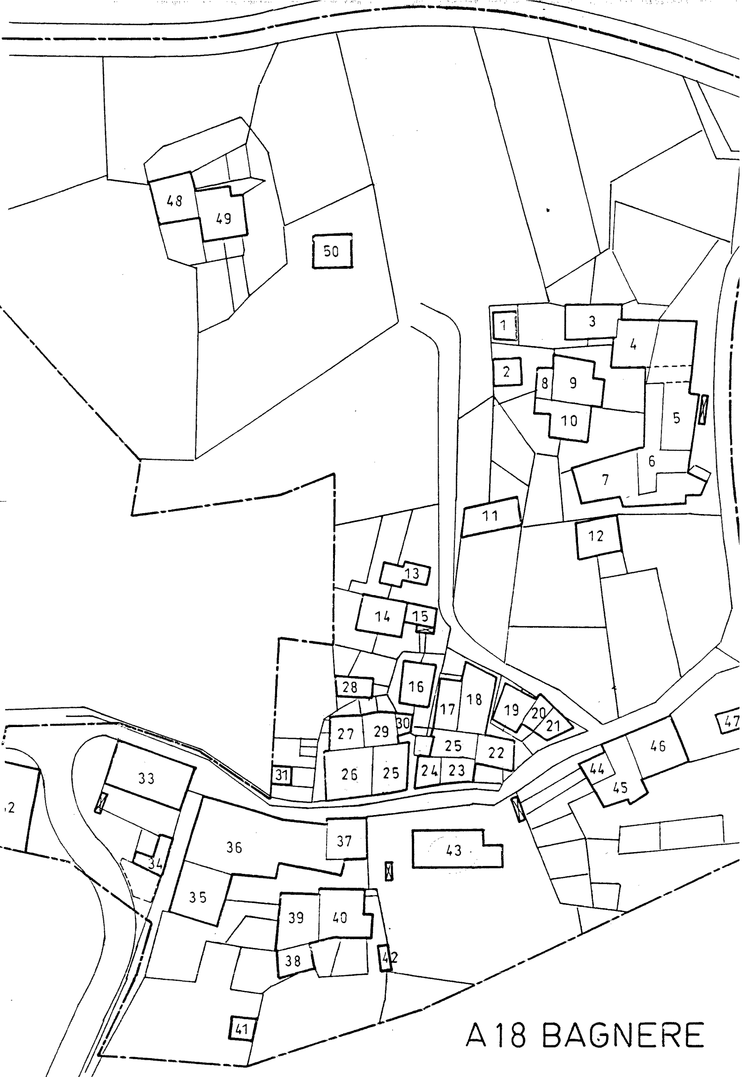
A 18 BAGNERE